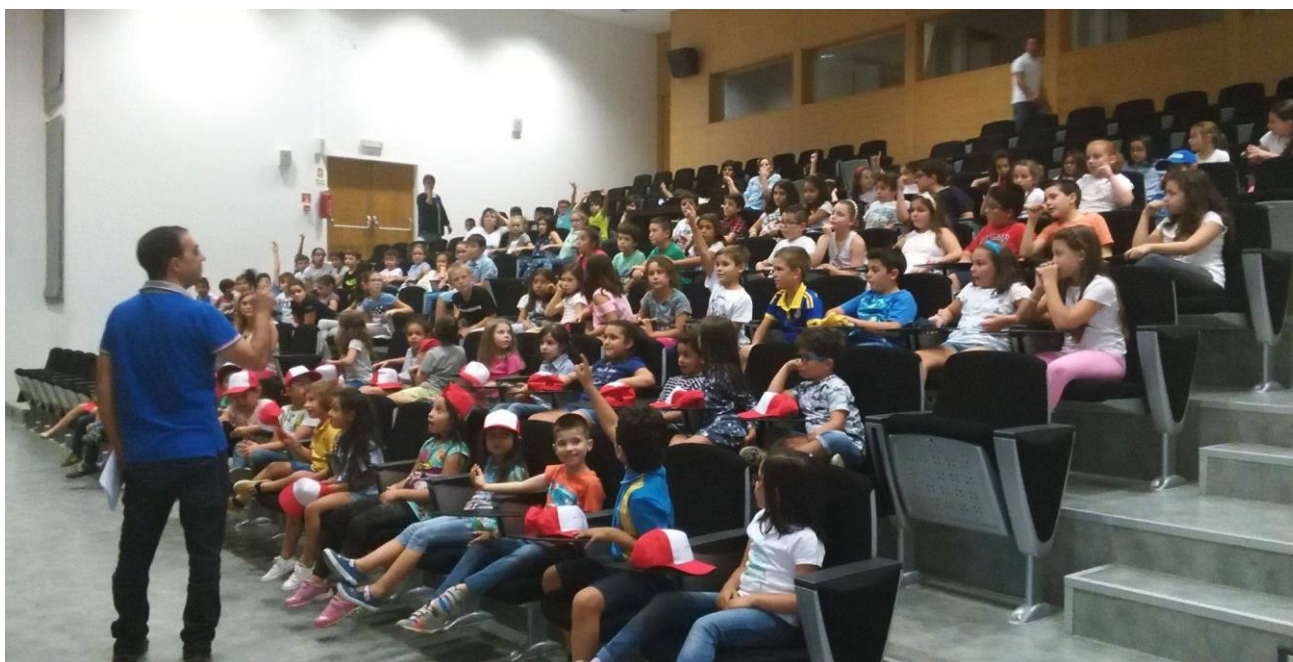
Imagens: Júris e premiados no Cine-Eco, em Seia. Sessão comentada de cinema para escolas. Outubro 2017.