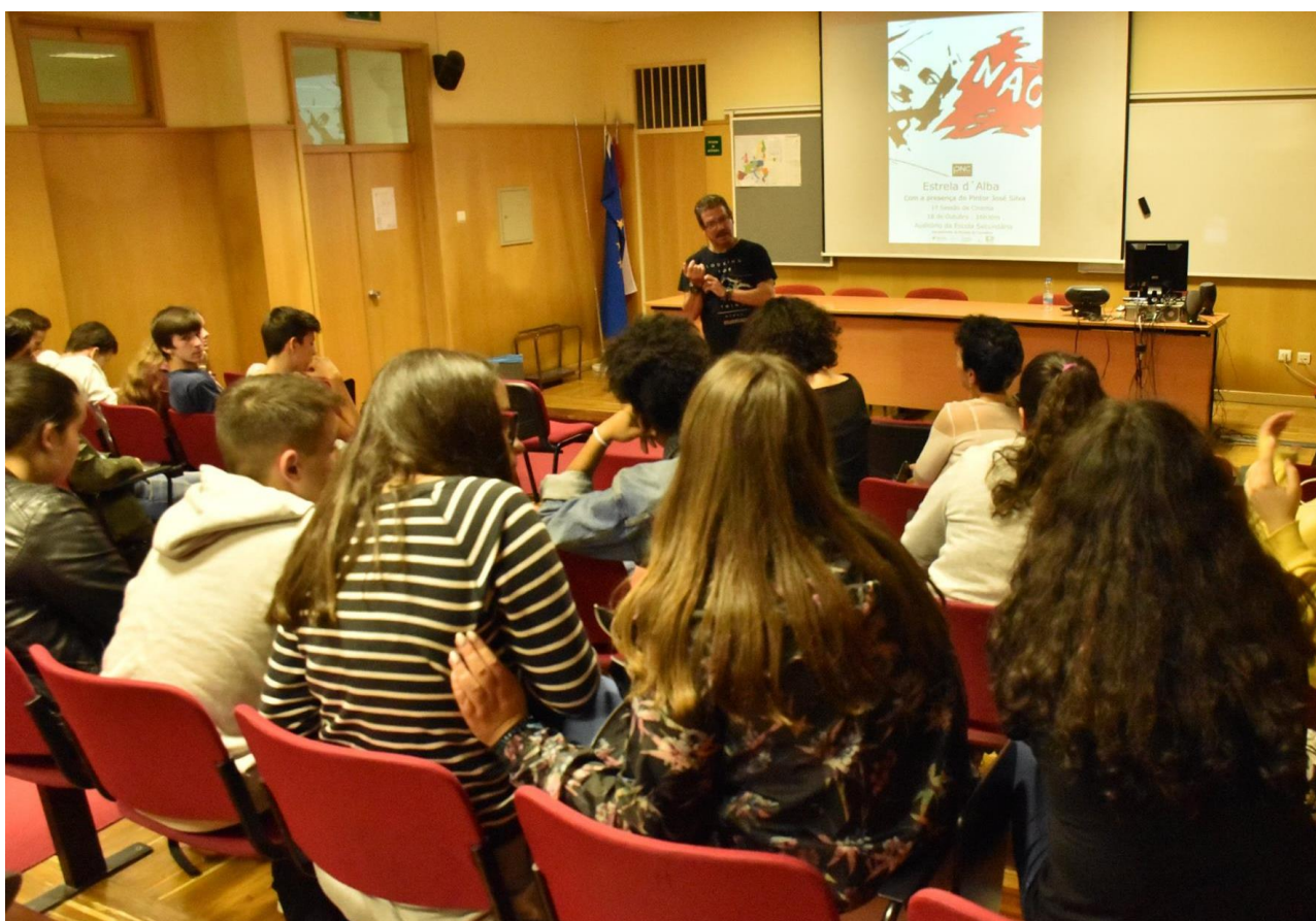
Imagem: Escola Secundária de Carvalhos, 1.ª sessão de cinema sobre «Os Sem Abrigo e a Arte».

No seu quadro político-estratégico, Portugal contempla objetivos de inclusão social das pessoas. As políticas educativas definidas consagram o direito à integração de alunos com necessidades educativas específicas ( http://www.dge.mec.pt/politica-inclusiva ), e o modelo da escola inclusiva é uma exigência social e política que se impõe, criando espaços para o cumprimento de valores como a democracia, justiça social e solidariedade e o direito de todos à educação. É intenção do Plano Nacional de Cinema promover e divulgar a concretização de atividades que se inspirem neste conjunto de princípios.