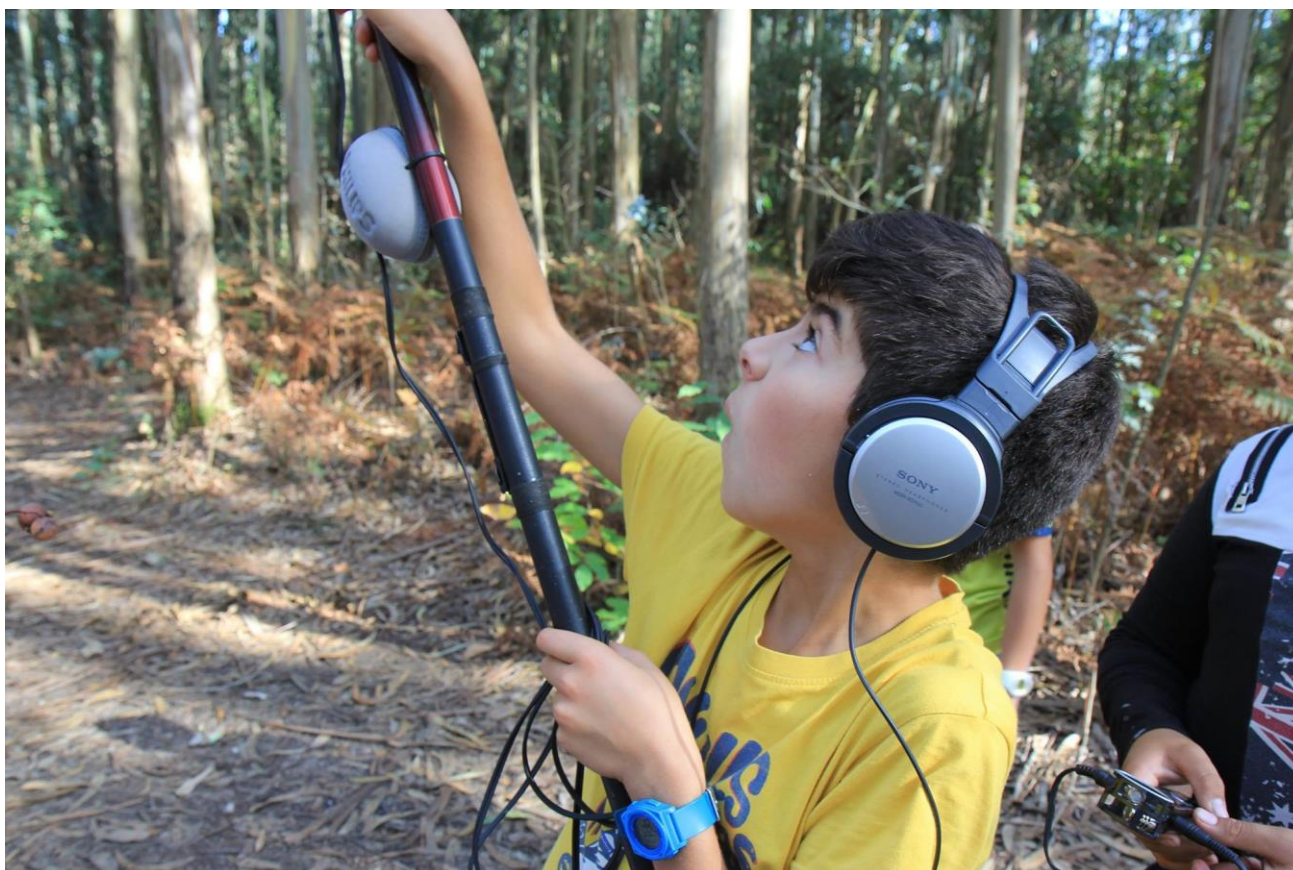
Imagens: Captação de sons ambientes pelos alunos do AE de Ovar Sul.